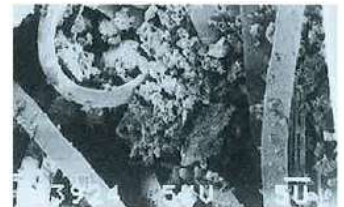
電子顕微鏡写真×1000 ※Uはミクロンをあらわす。

※ベリーマX及びザヴィーナ ミニマックスは、KBセーレン株式会社の登録商標です。